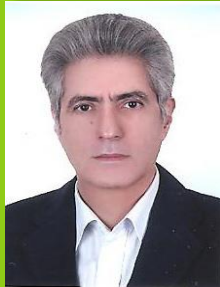
دکتر داریوش مظاهری