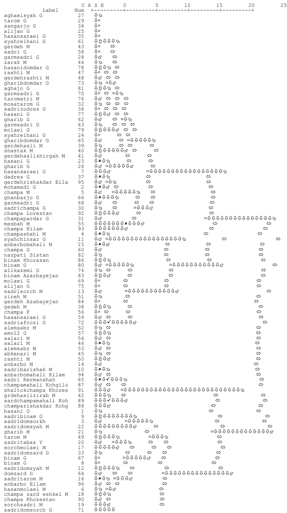
Fig. 10. Cultivar clustering of the whole country (Iran)