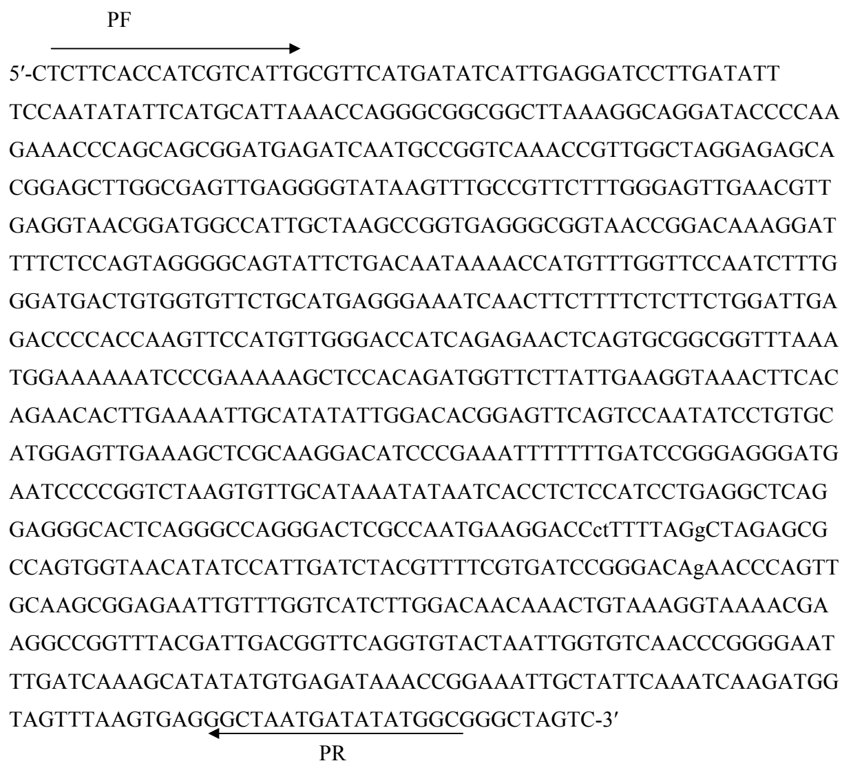
شکل ۴- قسمتی از ژن مشابه PDR5 جداسازی شده از گندم. ( آغاز گره های PR و PF با فلش مشخص شده اند)