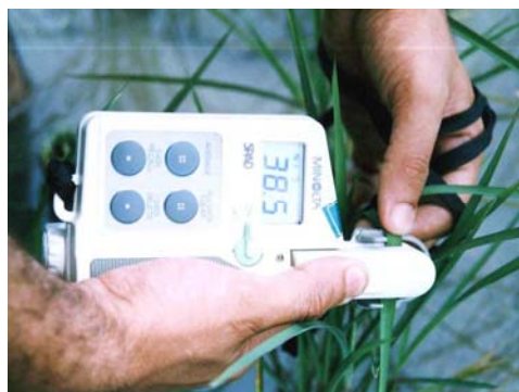
شکل ۱- دستگاه کرووفیل متر دستی (SPAD-502)

کرووفیل متر دستی (SPAD-502, Minolta Co. Japan) ۹۰ قرائت انجام شد (Peng et al., 1993, 1995b) انجام گرفت، به طوری که برای هر کرت (شکل ۱).