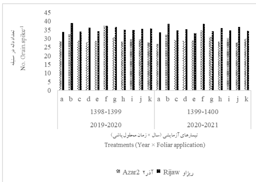
شکل ۲- مقایسه میانگین تعداد دانه در سنبله ارقام گندم در برهمکنش تیمارهای سال، رقم و زمان محلول‌پاشی دودآب

نتایج تجزیه واریانس مرکب داده‌ها نشان داد که برهمکنش سال و محلول‌پاشی دودآب و رقم بر تعداد دانه در سنبله ارقام گندم در سطح احتمال پنج درصد معنی‌دار بود. بیش‌ترین تعداد دانه در سنبله برای رقم ریژاو در سال اول (۳۹) و در سال دوم (۲۷/۳) در تیمار محلول‌پاشی در مرحله برجستگی دوگانه و برای رقم آذر ۲ در سال اول (۳۷/۳) و در سال دوم (۲۴/۷) در تیمار محلول‌پاشی در مرحله برجستگی دوگانه+تشکیل گره دوم بدست آمد (شکل ۲). به نظر می‌رسد که تفاوت در میزان بارندگی در دو سال، باعث ایجاد این تفاوت بوده باشد. کم‌ترین تعداد دانه در سنبله در تیمار عدم محلول‌پاشی بدست آمد که این موضوع با نتایج فرهنگ و همکاران (Farhat et al. , 2021) مبنی بر کاهش