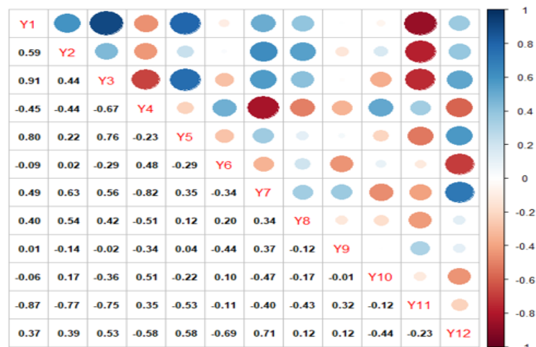
شکل ۱- ضرایب همبستگی بین عملکرد و اجزای عملکرد وش و شاخص‌های کیفی الیاف ارقام پنبه

در برنامه‌های دورگ‌گیری نیز از الزامات اصلاح ارقام برتر است (Liu et al. , 2021). تفاوت در عملکرد وش ارقام خارجی و ایرانی پنبه در آزمایش حاضر را