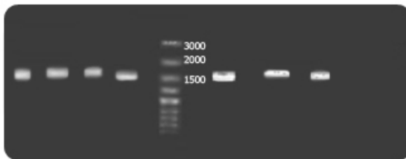
شکل ۱- تصویر ژل الکتروفورز گونه‌های جو، به ترتیب از چپ به راست:

H. spontaneum , H. bulbosom , H. brevisubultum , H. marinum , H. distichon , H. murinum , H. hexastichon .