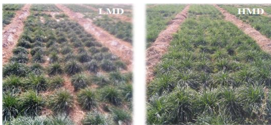
شکل ۲- مقایسه عملکرد علوفه نتاج حاصل از پلی‌کراس ژنوتیپ‌های والدی با تنوع مولکولی زیاد و کم (HMD و LMD) در شرایط بدون تنش خشکی

تاکنون بیشتر مطالعات انجام شده در باره هتروزیس در گیاهان علوفه‌ای روی افزایش رشد یا عملکرد متمرکز بوده و مطالعات اندکی در زمینه اثر تنش خشکی بر رابطه میان فاصله ژنتیکی والدین و هتروزیس نتاج و رابطه بین هتروزیس عملکرد و تحمل به تنش صورت گرفته است (Fujimoto et al. , 2018).