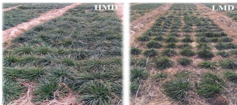
شکل ۳- مقایسه عملکرد علوفه نتاج حاصل از پلی کراس ژنوتیپ‌های والدی با تنوع مولکولی زیاد و کم (HMD و LMD) در شرایط تنش خشکی