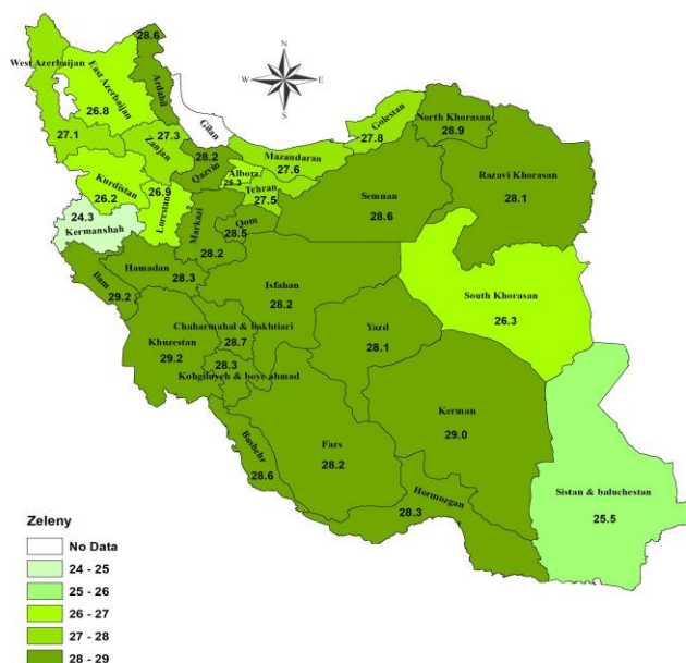
شکل ۲- حجم رسوب زلنی (میلی لیتر) دانه گندم تولیدی در مزارع کشاورزان استانهای کشور (۱۳۹۲ تا ۱۳۹۷) Fig. 2. Zeleny index (ml) of wheat produced in farmers' fields in the provinces of country (2013-2018)

نتایج مربوط به میانگین حجم رسوب زلنی دانه گندمهای تولیدی مزارع کشاورزان استانهای کشور نشان داد که استانهای خوزستان و ایلام با ۲۹/۲ میلی لیتر